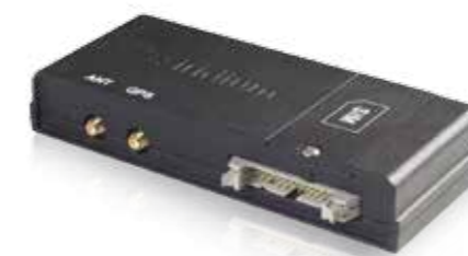
Приемопередающая установка Иридиум 9522В по передаче голосовых и цифровых данных