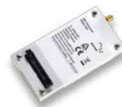
Модем Иридиума 9601 SBD

Современные критически важные приложения от компании Иридиум тщательно испытаны в самых суровых условиях, известных человеку – от студеной Арктики до экваториальных пустынь, от летящих высоко в небе самолетов до роботизированных подводных планеров.